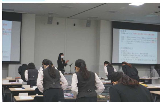
新入職員研修会に外部講師を迎え、マナー研修を行いました。