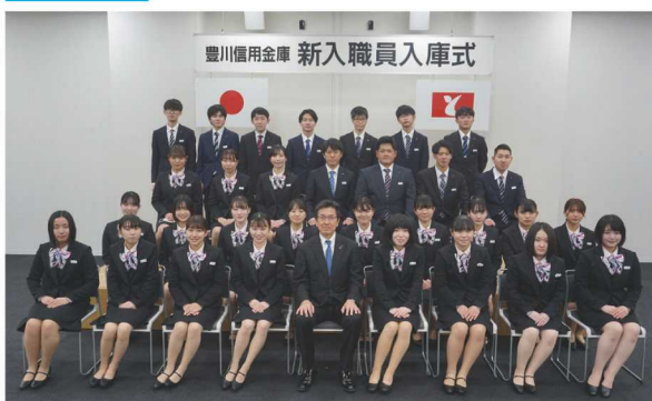
研修センターで入庫式を開き、新入職員32名（男性11名、女性21名）が入庫しました。（写真撮影のためマスクは外しています）