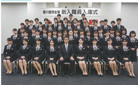
研修センターで入庫式を開き、新入職員53名（男性14名、女性39名）が入庫しました。（写真撮影のためマスクを外しています）