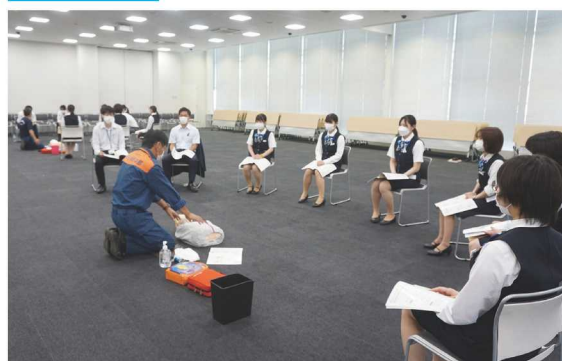
豊川市救命救急消防士を講師に迎え、新入職員50名が救命講習を受けました。